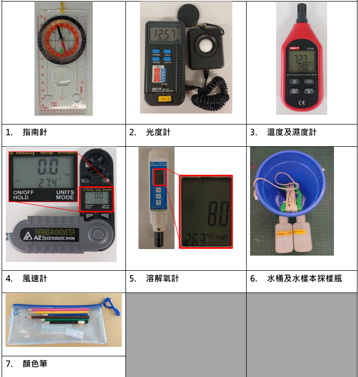
表 2 考察儀器/工具